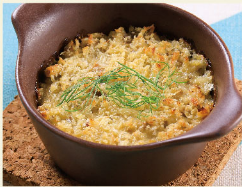
ひき肉とマカロニのグラタン ¥750