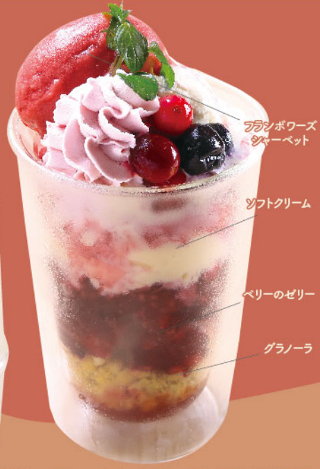
フィンランドフェアパフェ ¥850

フランボワーズシャーベットや、リンゴンベリー クリーム、ベリーをトッピングしたフェア限定の パフェです。