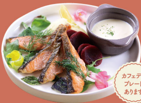
カフェデリプレート あります