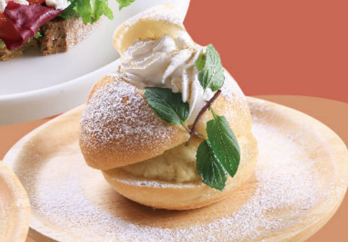
ラスキアイスプッラ ¥450

フィンランドのクリスマスバイ。ブルーのジャムを のせました。ヨウルはクリスマス、トルトゥはパイのこと。