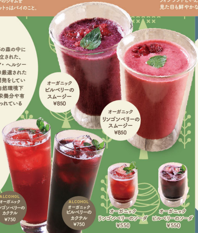
オーガニック ビルベリーの スムージー ¥850

いわゆるコケモモ。北欧をはじめとするヨーロッパの寒冷地で自生しているため、地域の人々に親しまれてきました。