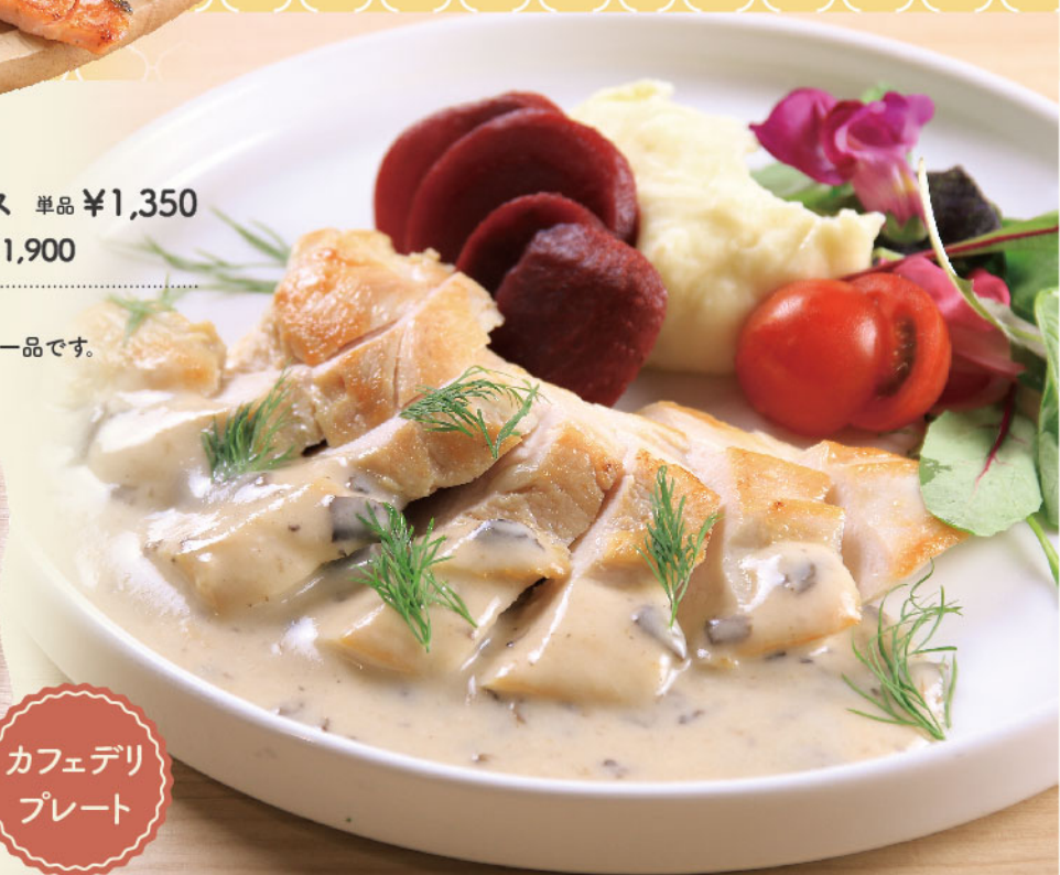
カフェデリプレート

フィンランドでは鶏のむね肉がよく食べられています。ポルチーニが香るクリーミーなソースと鶏むね肉の相性がぴったりな一品です。