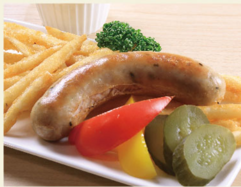
大きなソーセージ ¥850