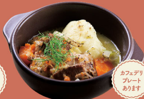
カフェデリプレート あります