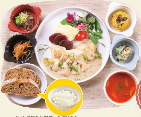
パンかご飯をお選びいただけます