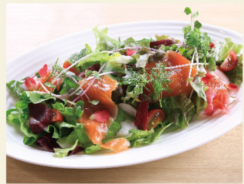
フィンランド風スモークサーモンサラダ ¥900

スモークサーモンの塩気がおいしい。 フレンチドレッシングでお召し上がりください。